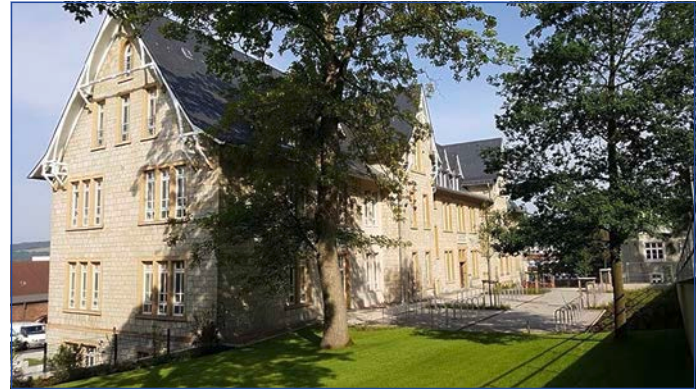
Fachhochschule der Diakonie (FHdD) in Bielefeld

Nach drei Jahren wird sowohl die Theoretische Prüfung (1. Teil des Fachschulexamens) absolviert als auch das Abschlusskolloquium (2. Teil des Fachschulexamens) präsentiert. Der Studierende erarbeitet im dritten Jahr der Ausbildung ein Kolloquiumsthema, in dem er anhand der Auseinandersetzung mit diesem die fachliche Kompetenz theoretisch wie praktisch miteinander verbunden nachweist.