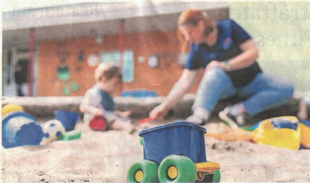
Besonders gefragt ist die Ausbildung zur Erzieherin.

So fehlen etwa in Deutschland derzeit insgesamt 125 000 Erzieherinnen laut einer bundesweiten Umfrage des Paritätischen Gesamtverbandes vom Juni dieses Jahres. Das entspricht zwei